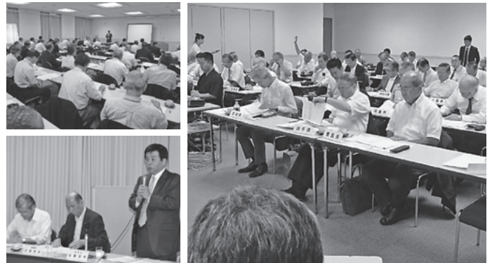
消費税外税化表示、改正耐震改修促進法、固定資産評価の見直しの各議題について協議した第2回緊急支部長会議。日本旅館協会からは近兼会長らが出席した

◇改正耐震改修促進法に関する件＝耐震診断と改修への補助制度問題が焦点となっている改正法であり、現在全国の組合が知事への陳情を展開（知事への