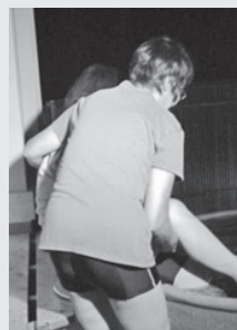
トラベルヘルパーによる入浴介助(左)を行っている熱川プリンスホテルでの意見交換会の様子(右)

組合は「誰もが温泉を楽しめるような施設づくりを進めていきたい。また、これを出発点に今後より深く、幅広く、宿泊や温泉を楽しんでもらえるシステム、ビジネスモデルづくりを進めていきたい」としている。