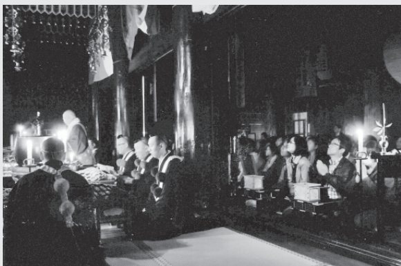
蔵王堂内で声明を聞く拝観者

組合では平成25年4月27日～6月2日までのご開帳の期間にも全12夜の「夜間拝感」を計画した。