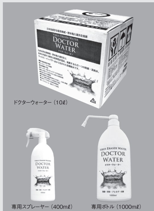
ドクターウォーター（10ℓ）