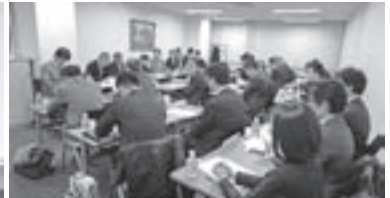
協定商社会との懇談会の様子