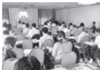
マスコミ等への情報発信会