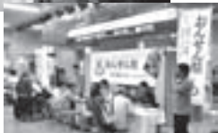
大阪駅等でのプロモーションのようす