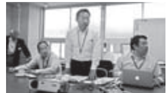
説明をする松山市産業経済部の みなさん