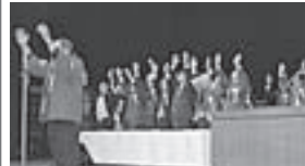
力強く行われた万歳三唱