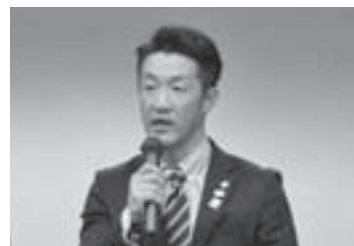
所信を述べる桑田部長