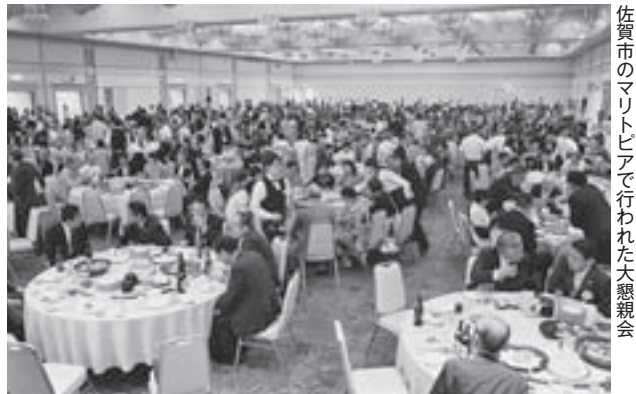
佐賀市のマリトピアで行われた大懇親会