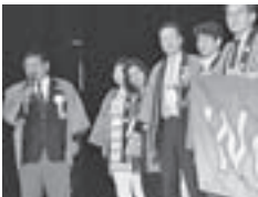
次期大会の開催地となる 東京都のみなさん