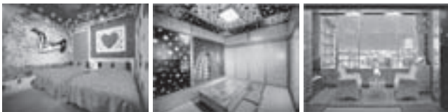
客室の様子。部屋のどこかに8人の作者が隠れているという仕掛けもおもしろい