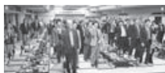
役員らによる全国大会前夜祭会場