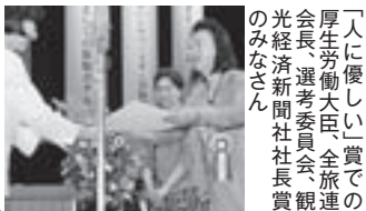
「人に優しい」賞での 厚生労働大臣、全旅連 会長、選考委員会、観 光経済新聞社社長賞 のみなさん