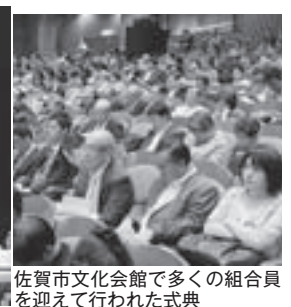
佐賀市文化会館で多くの組合員を迎えて行われた式典