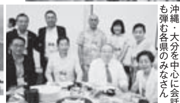
沖縄・大分を中心に会話 も弾む各県のみなさん