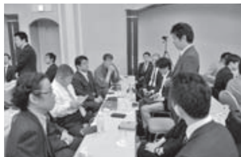
桑田体制初の委員会