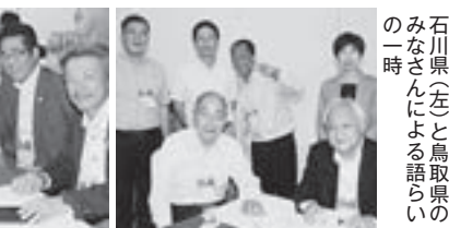
石川県全生と鳥取県の のみなさんによる語らい の一時