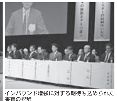
インバウンド増強に対する期待も込められた来賓の祝辞