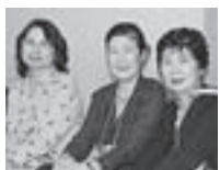
長崎県と埼玉県の女将 さんたち。右は鹿児島 県のみなさん