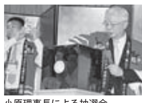
小原理事長による抽選会