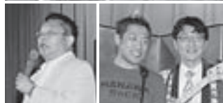
懇親会場を盛り上げた島田洋七やはな わのみなさんらによるアトラクション