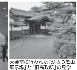
大会前に行われた「からつ曳山 展示場」と「旧高取邸」の見学