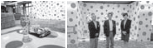
ホテルのラウンジの様子。 スイーツ、カップ&ソーサーにもデザインが施されている