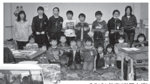
そろばん教室(学習支援)に通う子どもたち

子どもたちの学習支援は授業の中断を余儀なくされた子どもたちの学習が遅れることがないようにと6月中旬から大学生のボランティアの協力で行ったもので、客室や会議室を開放し、寺小屋として学習の場を設けた。これには「観洋ぐるりんバス」も活用され、今でも継続して行っている。学習支援は施設使用料、授業料ともに無料とし、ホテル宛に届いた義援金はそろばん教室などの学習支援に役立てている。現在も50人以上の子どもが館内の教室に通っている。「観光で来られるお客さまはもちろんのこと、南三陸町民の皆さまにも集いの施設として活用してもらい、多くの人たちと共に復旧・復興への道を歩んで参ります」と館主の決意は固い。