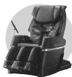
マッサージチェア