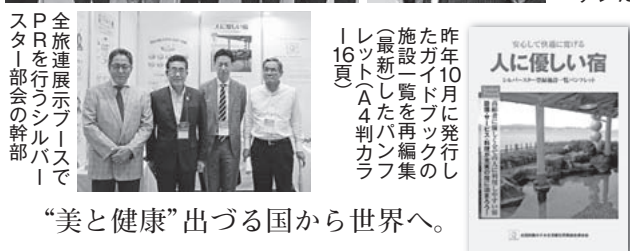
昨年10月に発行し たガイドブックの 最新版を再編集し たパンフレットA4判 16頁