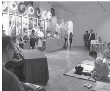
展示ブース内裏千家茶道披露