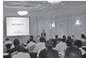
労務管理セミナー(東海)の様子

9月14日に愛知・名古屋マリオットアソシアホテル、17日には東京・都道府県会館において中小規模施設向け「労務管理セミナー」を開催した。内容は、①労務トラブルの実例と対策就業規則の整備、②短時間正社員制度の提案、③マイナンバー(社会保障・税番号)制度への対応など(詳細は11月号に掲載)。18日の委員会では、セミナーについて検証した。