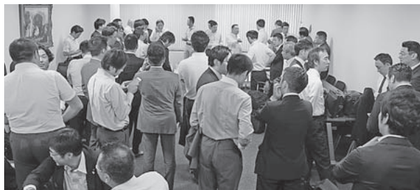
陳情の説明に集まった全国の部員たち