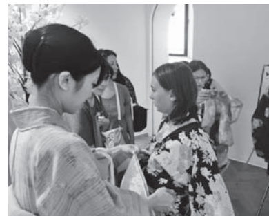
浴衣の体験の様子