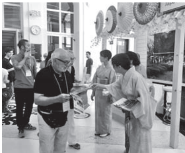
回廊ブースでRYOKANパンフレットを配り紹介する様子