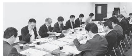
数々の賞を決める選考委員会

起こしていく、その活動こそが“全旅連の力”を育む大きな基盤となっていくものです。数々の