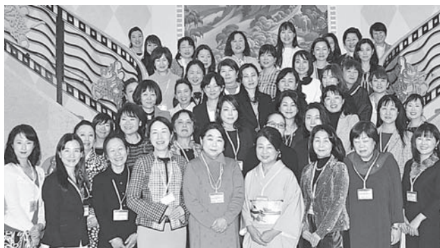
2つの講演会場となったホテルでの集合写真