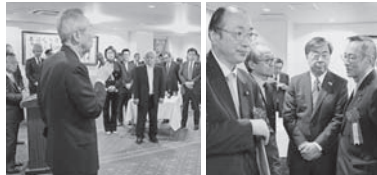
全旅連理事会(上)、旅政連支部長会議(中)、旅政連全国の集い(下)