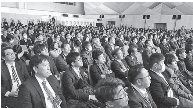
ファイナリストのプレゼンに涙し、感動する会場のみなさん

今回は、全旅連に所属する旅館など全国1350施設から出場希望施設を募り、各都道府県組合青年部長の