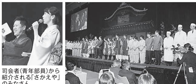
司会者（青年部員）から紹介される「さかえや」のみなさん

推薦を受けた87軒がエントリーした。実行委員会による1次審査で18軒の施設に絞られ、このあと旅館業、飲食業、行政、コンサルタント業等の異業種の有識者からなる8人の審査委員による2次審査（書類審査）で5軒がファイナリストとして決勝進出した。