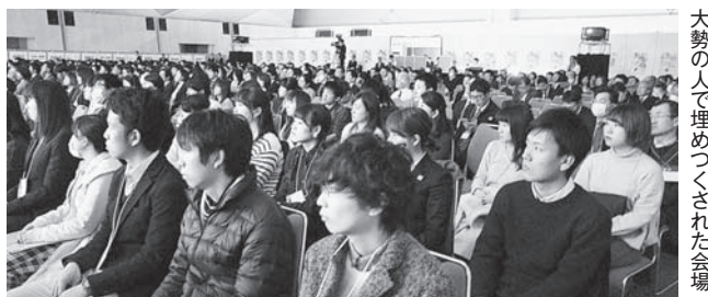
大勢の人で埋めつくされた会場