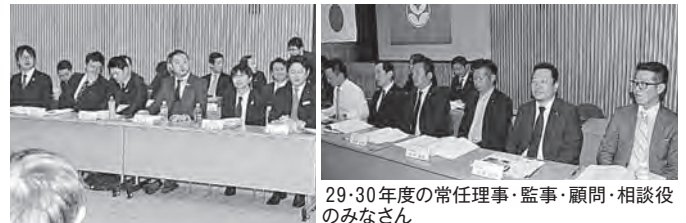
29・30年度の常任理事・監事・顧問・相談役のみなさん