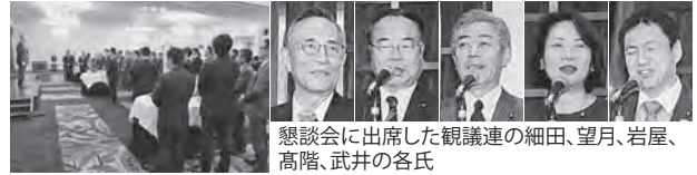
懇談会に参加した観議連の細田、望月、岩屋、高階、武井の各氏