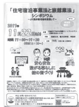
シンポジウム開催告知ポスター