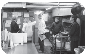
調理担当者を交えて検証