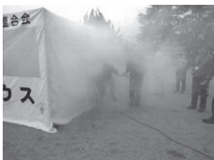
煙体験ハウスによる避難訓練