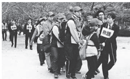
救護班による搬送訓練

同組合は震度6弱以上の地震が発生した際の宿泊客対応計画を平成27年に策定(各施設は帰宅困難客の受け入れのため最低3日間の食料や水を備蓄)、また、組合員には防災士資格の取得を勧める(現在6割の施設が取得)などして災害対応能力の向上に努めているが、民間企業、市民、行政組織が一体となって行うこうした一連の合同訓練は、「非常時には地域全体を全員で守る」という強い意識が込められた訓練となっている。