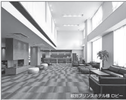
個別プリンスホテル様 ロビー