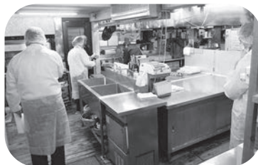
調理作業現場を視察