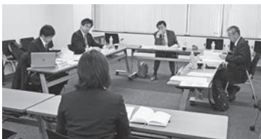
協定商社会入会審査(面談)の様子

経営基盤調査研究委員会(宮村耕資委員長)は、12月22日に3回目の委員会を開催し、協定商社会入会審査会を行った。