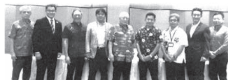
観光と地域住民との共存を目指していくことで一致した