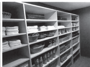
ホテルの非常食等の備蓄庫