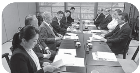
参加した委員で意見交換