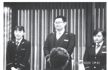
先進事例調査訪問で伺ったホテルで働いている外国人の従業員の皆さん