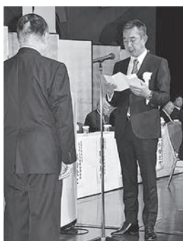
謝辞を読む西上熊本県理事長