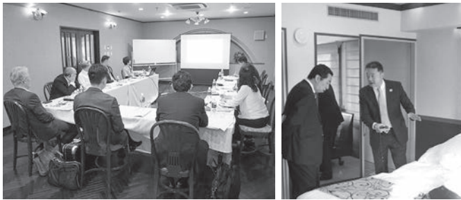
ホテルのスタッフより取り組みについて説明を受ける委員

先進的に取り組んでいる「富士レークホテル」の 「客室」「浴室」「トイレ」「ノウハウ」など視察