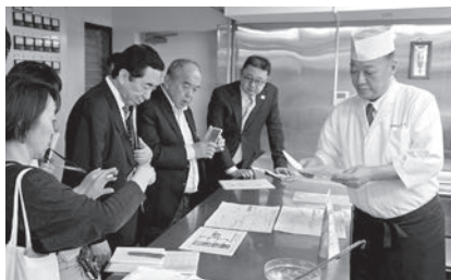
「きざみ食」について説明を受ける委員