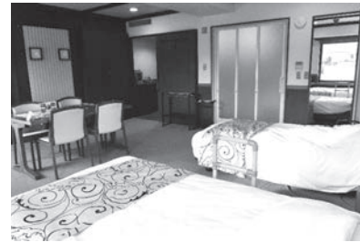
バリアフリー対応客室