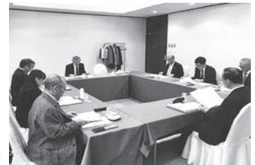
ワーキンググループでの検討会

ガイドブックは組合員や関係施設へ配布したほか、県内3カ所で開催した「外国人の在留資格や新たな技能実習制度に関する研修会」でも活用した。