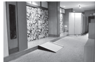
宴会場の入口に設置された 仮設スロープ