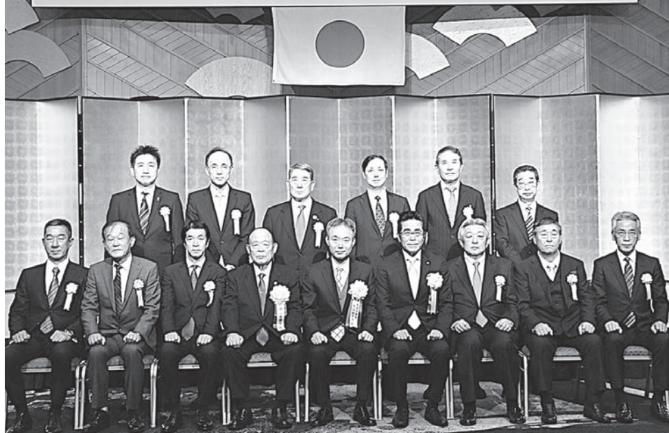
令和元年度生活衛生功労者表彰式出席のみなさん