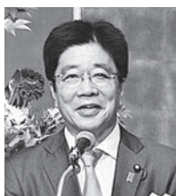
あいざつする加藤勝信 厚生労働大臣