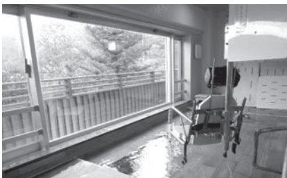
入浴介助リフト(水圧で上下する)