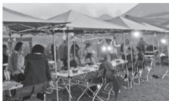
阿蘇山の牧草地でBBQの視察

阿蘇地域では、平成28年の熊本地震を境にして観光客が落ち込み、以来少しずつ回復は見せているが、熊本地震前と比べると観光