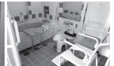
浴室の貸し出し備品 (移乗台、手すり、シャワーチェア)

あった。このようなトライアルを踏まえ、段階的に改修を進め、現在では全74室のうち23室がバリアフリー対応の客室となっている。さらに、一般の客室の改装の際には、ダクトスペースなどを活用してトイレ部分を使いやすくするなどし、より利用しやすい部屋づくりをしている。