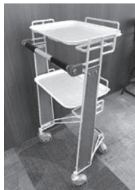
朝食バイキングの際に、 トレーを2段載せられる カートを提供

富士レークホテルで人気が高いものは、貸切風呂である。「レークビュー貸切風呂」には入浴介助リフトがあり、簡単な操作で障害をもった方でも温泉を堪能することが可能となった。また「富士山展望貸切風呂」は、デラックススタンダードルームとコネクティングルームとなっており、客室から直接行き来することが可能である。障害などがあると大浴場が使いにくいことがあるが、貸切風呂であれば、気兼ねなく温泉を堪能することができる。