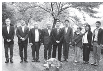
現地調査に参加した委員

取材を通して感じたスタッフの方のホスピタリティもあいまって、一度利用するとリピートされる方が多いという魅力あふれるホテルである。