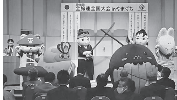
山口、下関、湯田、萩、岩国各市のゆるキャラが登場した山口全県あげての歓迎ステージ

多田会長はまた国のGo Toトラベルキャンペーンについては「これは疲弊した観光業界を立て直すための一筋の光として進められたものであり、自民党総裁選の菅義偉候補の出陣式(9月8日)でも民間人代表として