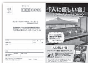
【キャンペーン応募ハガキ付チラシ】

「人に優しい宿(シルバースター登録施設)」では、高齢者や障害のある方はもちろん、全ての人にご満足いただけるよう、登録施設同士が切磋琢磨しサービスの向上に努めております。