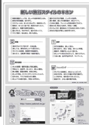
【チラシ裏面】 新しい旅行スタイルのキホン 等を掲載