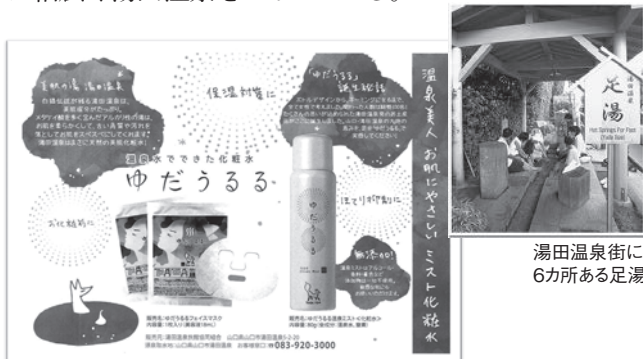
温泉水をたっぷり含んだ「ミスト」と「フェイスマスク」

旅館売店を中心に販売しているが、湯田温泉以外にも販売できるよう販路拡大中だ。今では山口市のふるさと納税返礼品として起用されており、「ゆだうるる」は幅広く湯田温泉をPRしている。