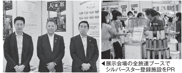
◀展示会場の全旅連ブースでシルバースター登録施設をPR

北出氏はコロナ禍での温泉地の取組みについて述べ、インターネット環境があればいつでもどこでも楽しむことができる「疑似旅行」であるオンラインツアーについて解説。別府温泉(大分県)の「まち歩きオンラインツアーの配信」、琴平バス(香川県)の「仮想バス旅(添乗員や他の参加者とのコミュニケーションもオンライン会議アプリのZOOMを使ったオンラインバスツアー)」、長野県昼神温泉の「日本一のバーチャル星空を楽しむVR映像」、黒川温泉の「スマホ湯(スマホひとつで33軒の温泉に入