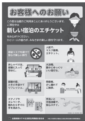
【ポスター】及び【チラシ】