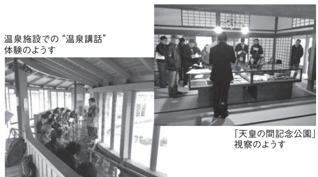
温泉施設での「温泉講話」体験の様子

同プロジェクトの具体的成果としては、多くの関係者と共に現状を体験することで課題や対策が共有できるようになったこと、また、次回予定の観光施設や飲食店へ案内書、実施画像、参加者名簿をわたすことで目的意識の共有化が図られたことなど。また、新たな発見となったことは、観光施設の利用状況や不整備箇所等の確認ができ、マンパワー（ガイド）を加えることで、お客様に満足してもらえることに気付いたこと。実際には観光施設や飲食店などに一度も行っていない人が多く、観光客に安心してお金と時間を使える雰囲気や仕組みの整備を図っていきたいとしている。