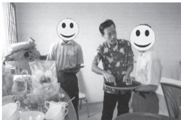
ホテルでの企業実習のようす

当ホテルでは、今後もすべての人が生き生きと生活できる地域社会を目指すためにも、学校と連携し、長期的な企業実習授業を受入れ、生徒の学ぶ力を先生方と一緒に引き出していければと考えている。