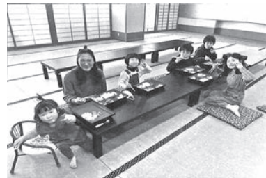
館内での学童保育のようす

「マルチタスクのお陰で、前年より10人少ない人数で秋の繁忙期を乗り切ることができた。今までトップダウンだった体制も、様々な取り組みを通じて社員自らが行動する自立型組織になったことが、何よりも嬉しい大きな成果だ」と社長は語る。今後は個室会食場の整備を行い、デイトムワーケーションが出来るように、時間貸しも検討していきたいと意欲的だ。