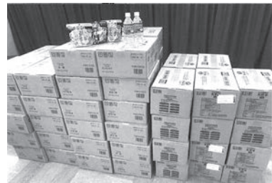
従業員と近隣住民の避難を想定した備蓄品