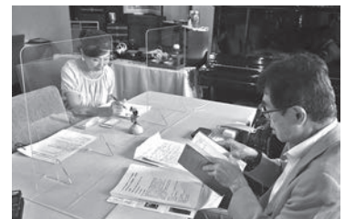
▲平塚選考委員（右）、女将にヒアリング