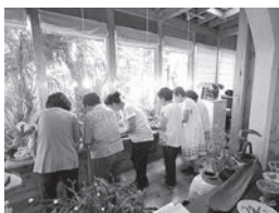
▲ボランティアさんと一緒に準備の様子