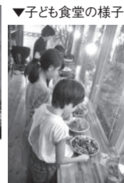
▼子ども食堂の様子