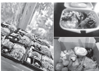
▲コロナ禍の為、子ども食堂にて配られた栄養満点のお弁当