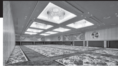
ホテルニューオータニ「鶴の間」