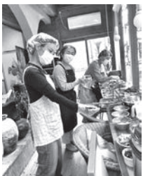
▲ボランティアさんと調理場にて