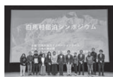
宿泊シンポジウムの様子

今後は、歯ブラシ等のアメニティを持参しなかった宿泊客に対し、有料で提供することを想定した、環境に配慮した「白馬村オリジナルのアメニティ」の開発についても視野に入れて行動していくとしている。