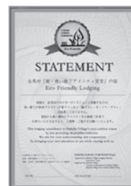
「脱・使い捨てアメニティ宣言の宿」 声明の掲示板