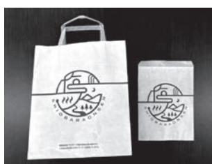
再生紙100%の紙袋と平袋